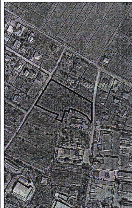
484 - numarul cadastral al terenului