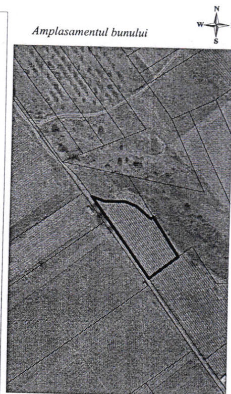
735 - numarul cadastral al terenului