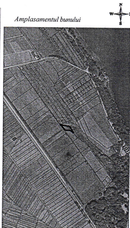
736 - numarul cadastral al terenului