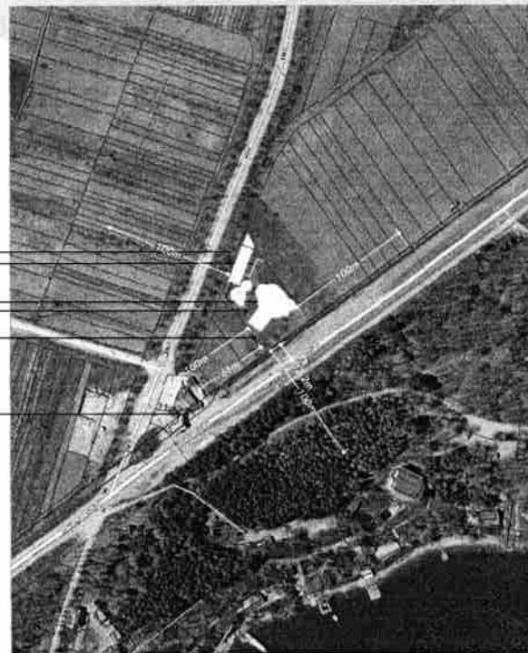
PLAN GENERAL sc. 1:500